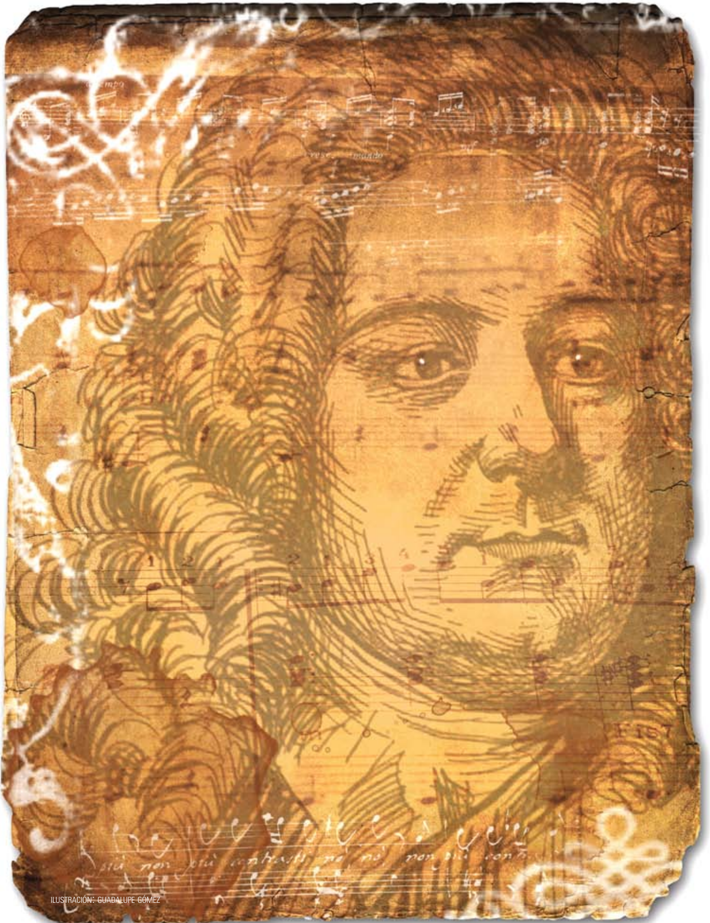
ILUSTRACIÓN: GUADALUPE GÓMEZ