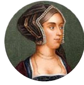
Catalina de Aragón