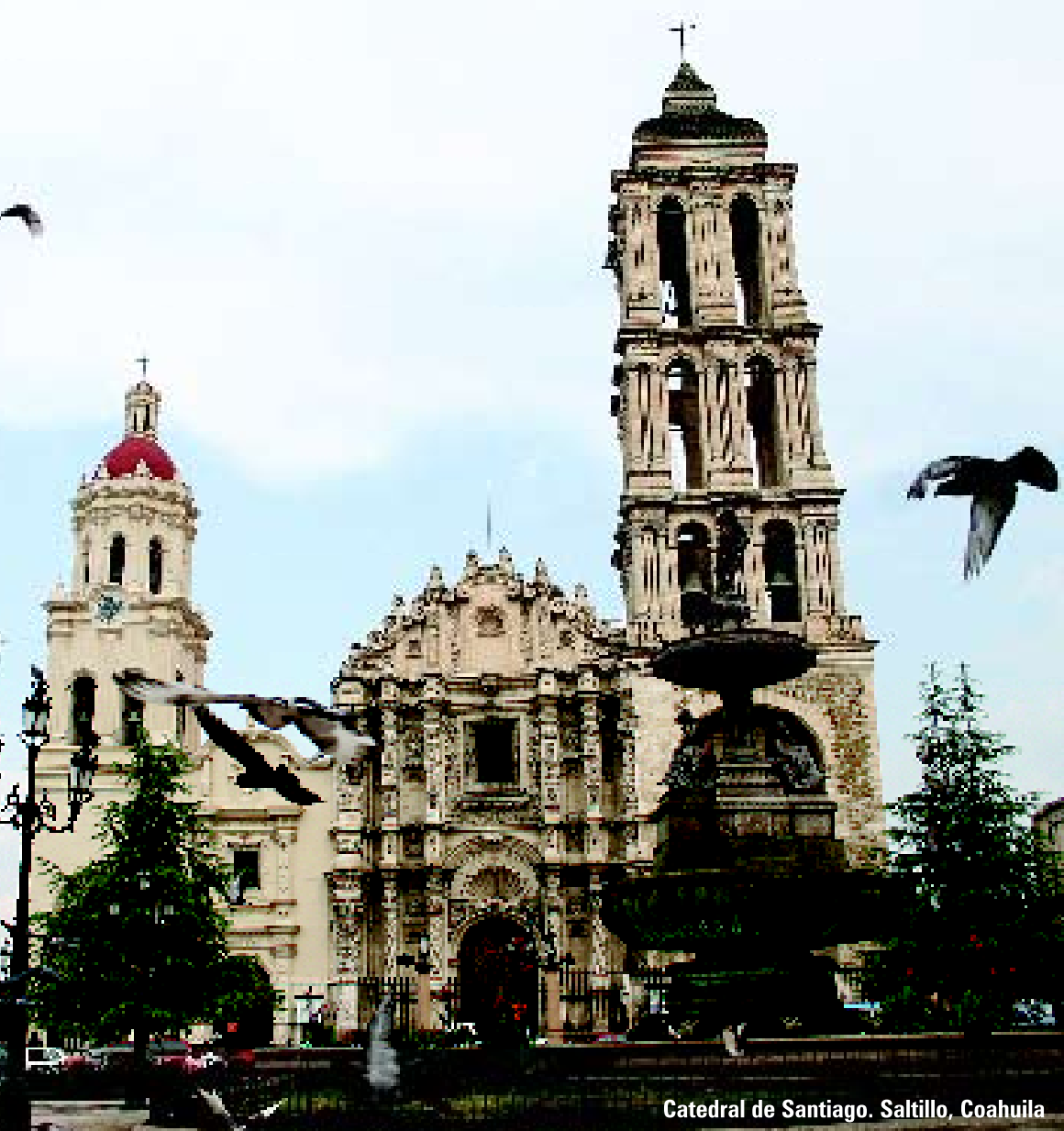
Catedral de Santiago. Saltillo, Coahuila