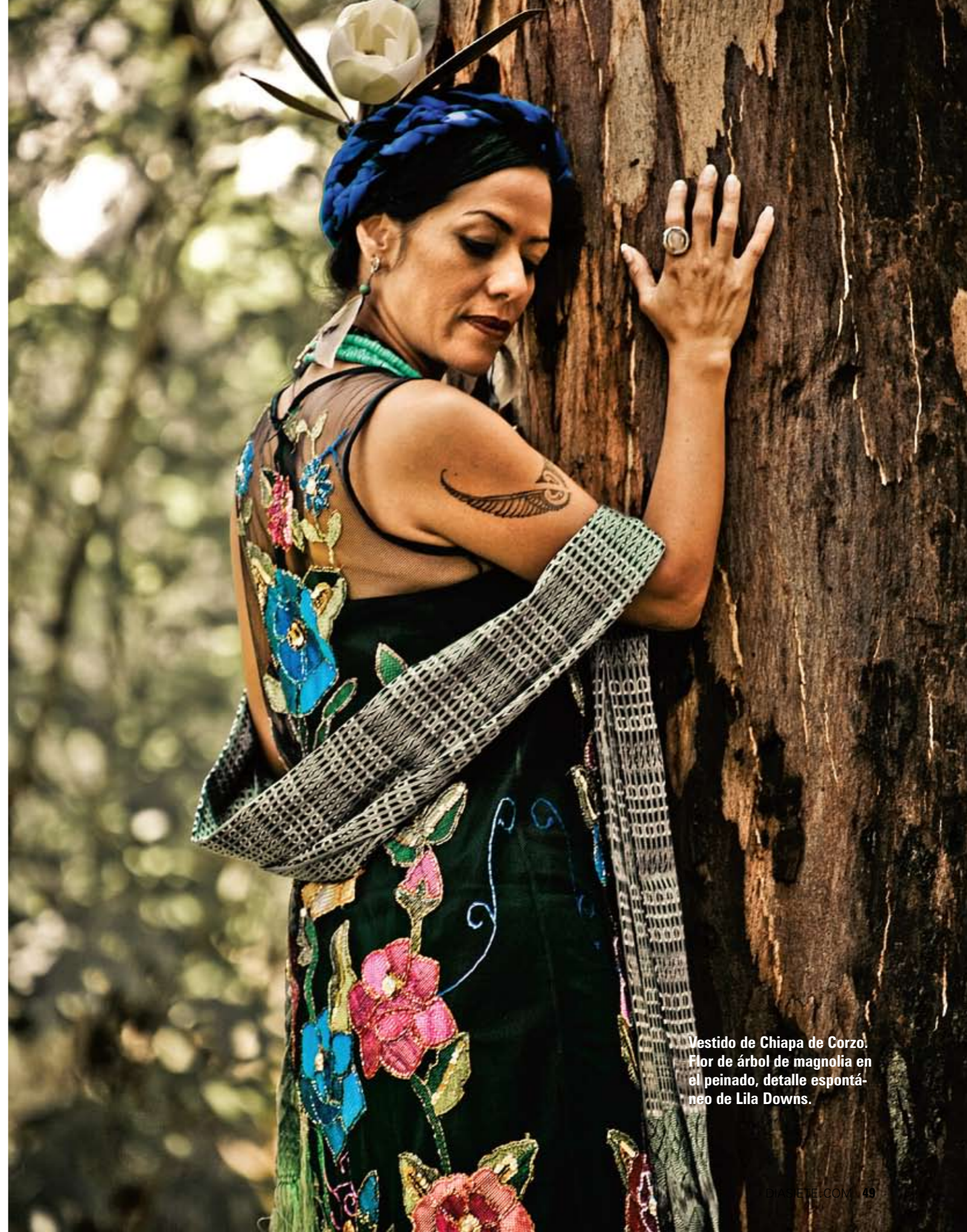
Vestido de Chiapa de Corzo. Flor de árbol de magnolia en el peinado, detalle espontáneo de Lila Downs.

Claro, hay mucha gente que nos conoce pero también las paisanas saben que soy oaxaqueña y que