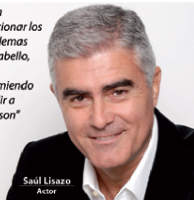
Saúl Lisazo Actor

"Para solucionar los problemas del cabello, yo te recomiendo acudir a Svenson"