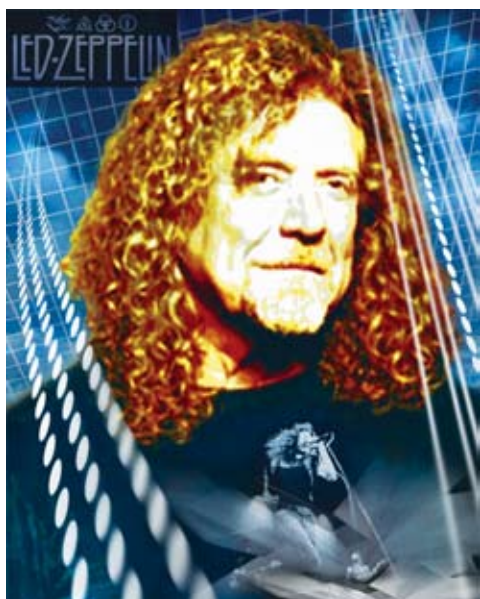
ILUSTRACIÓN: GUADALUPE GÓMEZ

El legendario ex vocalista de Led Zeppelin cumple 60 años y recién grabó Raising Sand , uno de sus mejores discos, afirma el autor del siguiente ensayo. Su música se ha encontrado con un nuevo lenguaje, alejado del rock y cercano al folk y al rhythm and blues. TEXTO: ENRIQUE BLANC