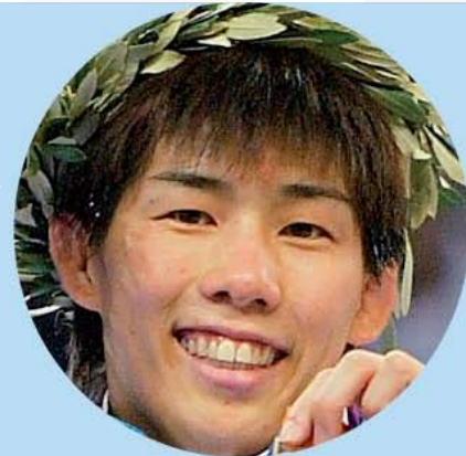
Saori Yoshida: 25 años de edad. Campeón olímpico en la categoría de 48-55 kg.