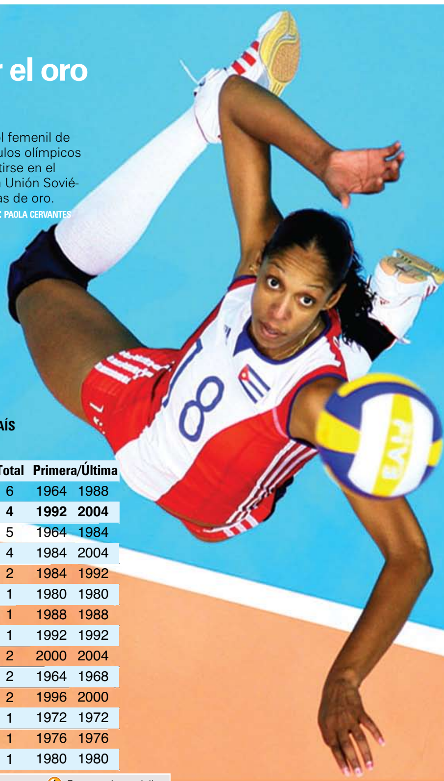
ILUSTRACIÓN: GRAPHIC NEWS • TRADUCCIÓN: PAOLA CERVANTES

Cuba, que dominó el voleibol femenino de 1992 a 2000 al ganar tres títulos olímpicos consecutivos, podría convertirse en el segundo país, después de la Unión Soviética, en ganar cuatro medallas de oro.