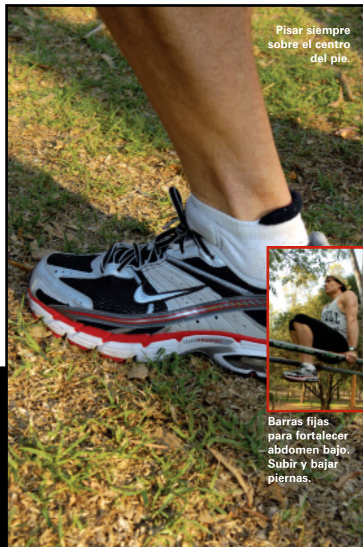
Pisar siempre sobre el centro del pie.

Sin embargo, tomar bebidas isotónicas o deportivas antes, durante y después del ejercicio aumentará el rendimiento y disminuirá el cansancio, ya que tienen gran capacidad de rehidratación. El día del corredor comienza tomándose el primer vaso de agua al despertar. Si llega a sentir sed, significa que su organismo ya sufre de algún grado de deshidratación.