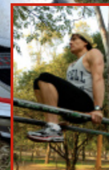
Barras fijas para fortalecer abdomen bajo. Subir y bajar piernas.

9 Fortalecer el abdomen. Haga abdominales y correrá mejor. Los músculos abdominales son con los que levantamos las piernas al correr . Para fortalecer otros músculos del cuerpo, los ejercicios sobre barras fijas son ideales, porque desarrollan su fuerza y le ayudan a modelar una figura atlética. Si prefiere utilizar pesas, realice rutinas de muchas repeticiones con poco peso. Con mucho peso y pocas repeticiones incrementará desproporcionadamente su masa muscular y perderá agilidad. Entre más ligero y flexible, más apto el corredor.