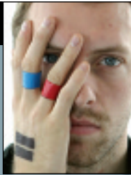
PORTADA COLDPLAY