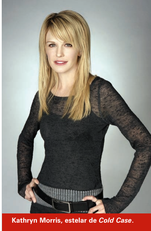
Kathryn Morris, estelar de Cold Case .

Sólo “los malos” merecen morir, de acuerdo a los protagonistas empeñados en redimir la figura del multihomicida convertido en verdugo de la escoria humana. Un policía descubre tendencias sicópatas en su huérfano adoptado. En lugar de llevarlo al psicoterapeuta, encauza sus pulsiones hacia una misión más noble: eliminar a capos peligrosos, pedófilos insaciables y asesinos de inocentes. ¿Qué más puede pedir el televidente acostumbrado a ver los noticiarios mexicanos?