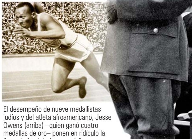
El desempeño de nueve medallistas judíos y del atleta afroamericano, Jesse Owens (arriba) —quien ganó cuatro medallas de oro— ponen en ridículo la “superioridad de la raza aria”.

Juegos Olímpicos Nazis. A pesar del llamado a un boicot, 49 países asistieron, dando al dictador nazi una victoria.