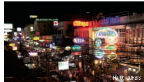
Las calles de Bangkok, lo mejor para las compras.