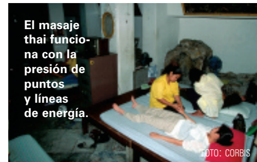
El masaje thai funciona con la presión de puntos y líneas de energía.

De los cientos de templos budistas o wats que están dispersos por todo Bangkok, deberá elegir a Wat Pho, el más antiguo y grande de la ciudad. El templo (abierto de 8 a 17 horas diariamente, admisión 50 bahts/16 pesos; tel. 00 66 2 225 9595; www.watpho.com) es un laberinto de 35 estructuras, una de las cuales es un Buda reclinado de 43m de largo que representa su paso hacia el Nirvana. "Los turistas deben estar vestidos apropiadamente, no se admiten shorts," previene un letrero. Wat Pho es también un centro para el tradicional masaje thai, el que podrá disfrutar por 250 bahts/85 pesos por una hora, o a aprender a darse masaje Usted mismo. •