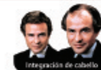
Integración de cabello