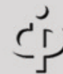
IMAGEN PÚBLICA® Colegio de Gran Clase

Impartido por los creadores de la Maestría en Ingeniería en Imagen Pública® y la Licenciatura en Imagología®