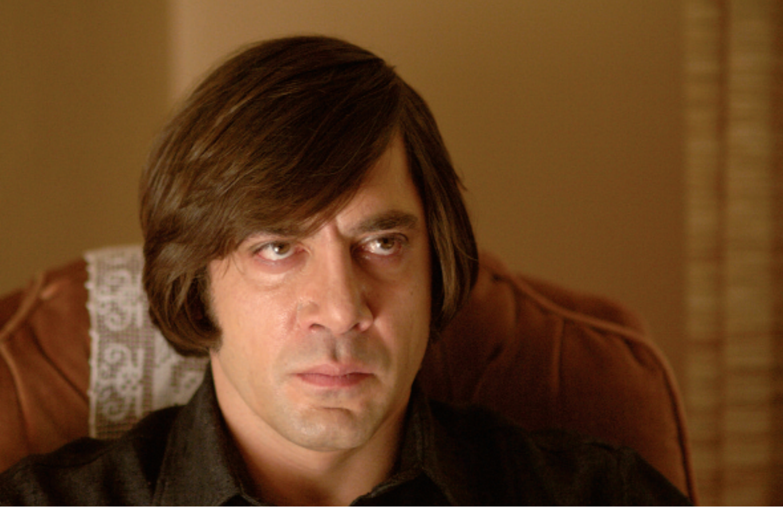
Por su papel del sicario Anton Chigurh en No Country for Old Men , Bardem ganó un Globo de Oro y es candidato al Oscar como Mejor actor de reparto.

“Deseas que tu trabajo guste, pero al mismo tiempo no puedes permitir que todo gire en torno a la aprobación...”