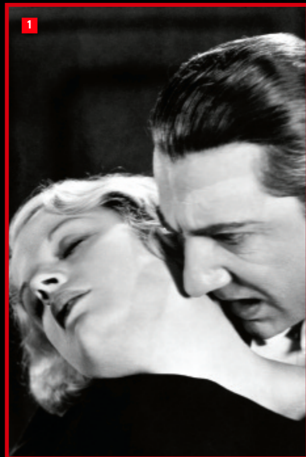
1. Bela Lugosi como Drácula. 2. Klaus Kinski como Nosferatu.

No es necesario ver la película para adivinar la trama: un vampiro centenario, varias víctimas desangradas, un amanecer criminal y definitivo. Es necesario verla, sin embargo, para conocer su elemento más perturbador: la figura del conde Orlok. ¿Conde Orlok? De nuevo: en su intento por esquivar la ley, Murnau imaginó un nuevo nombre y una nueva apariencia para el vampiro.