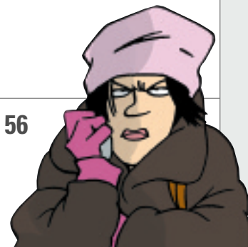
PORTADA LOS ÁNGELES DE CHARLIE