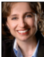
PORTADA CARMEN ARISTEGUI