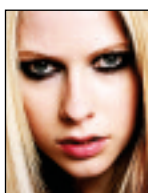
PORTADA AVRIL LAVIGNE