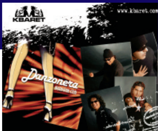
El disco de Danzonera Distorsión Club es punta de lanza del sello Kbaret.