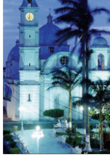
La parroquia de San Cristóbal data de 1849 y es uno de los primeros templos construidos en la ciudad.

Más antigua, aunque recientemente pintada en color crema en sustitución al blanco anterior, la Ermita de la Candelaria delata en su estampa su filiación colonial. Aún conserva ornamentos mozárabes en sus cúpulas. Patrona de la población, es en su honor que se celebran las sonadas fiestas del 2 de febrero.