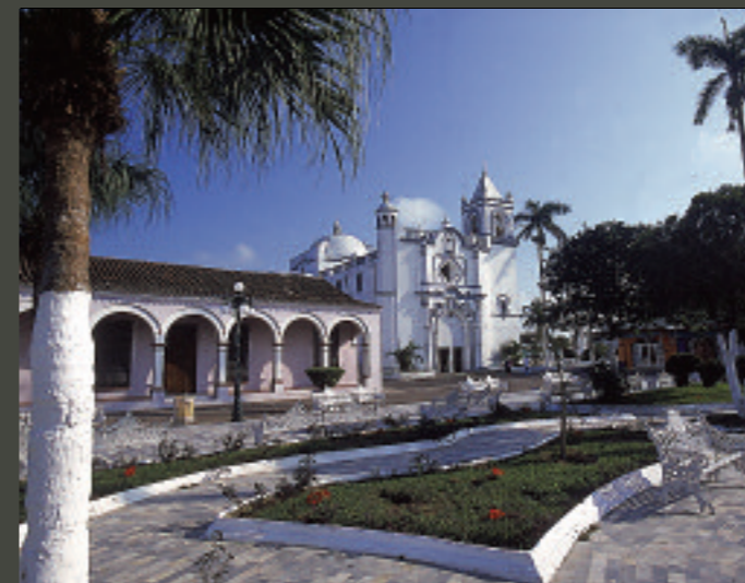
El templo de la Virgen de la Candelaria fue construido hace 221 años.

El Hotel Tlacotalpan es la otra alternativa de hospedaje en la población dentro de unos márgenes mínimos de confort. Como dato curioso cabe señalar que en la casa de enfrente nació el famoso músico Agustín Lara. Catorce habitaciones, 450 pesos con aire acondicionado. Rodríguez Beltrán 35. Tel. 01 (288) 884 2063. •