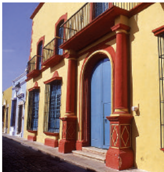
La Casa del "Teniente Rey", nombre que le concedió el rey de España en 1745.

Tres veces por semana, hacia el ocaso, aparecen en la Puerta de Tierra de la muralla guerreros mayas, conquistadores españoles, piratas malencarados y bravos caballeros que los expulsan al mar. No, no se trata de fantasmas, sino de actores de carne y hueso que reviven la turbulenta historia local ante el público que asiste al Espectáculo de Luz y Sonido. Martes, viernes y sábados, a las 20 horas. •