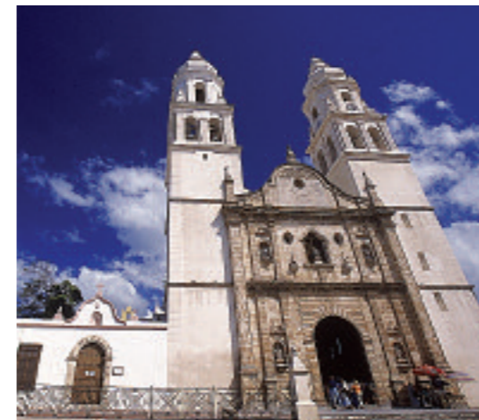
La Catedral de Campeche, de estilo barroco, se le otorgó su rango como tal en 1895.

En pleno escenario colonial, el Hotel del Paseo es una alternativa más económica que brinda 42 habitaciones dobles (a 570 pesos) y seis suites. Restaurante, bar, centro de negocios, tabaquería, estacionamiento y renta de automóviles. Calle 8, no. 215, San Román. Tel. (981) 81 10 100; www.hoteldelpaseo.com . •