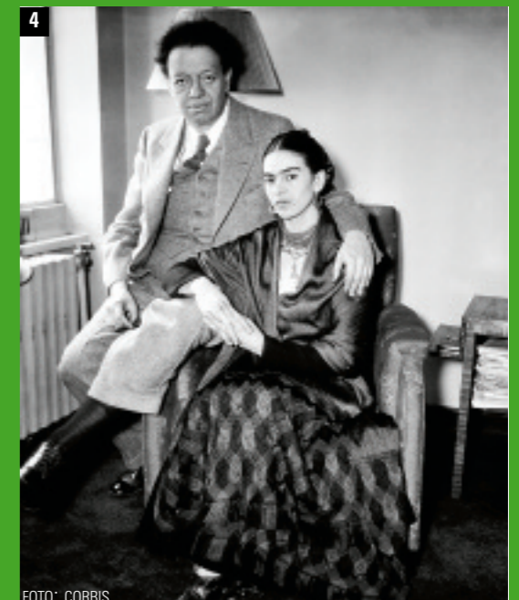
44 Una foto clásica de Diego y Frida, en 1939, cuando ambos eran activistas del Partido Comunista.