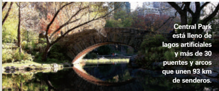
Central Park está lleno de lagos artificiales y más de 30 puentes y arcos que unen 93 km de senderos.

La Oficina Postal principal de Manhattan sobre la Séptima Avenida es un edificio impresionante cuyo recinto principal está decorado con escudos de armas, uno de Francia, bajo cuyo sistema postal fue diseñado el de los EU. •