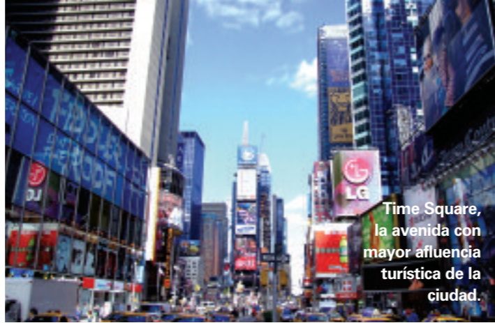
Time Square, la avenida con mayor afluencia turística de la ciudad.

El Parque Central es una atracción para locales y visitantes, con sus prados, bosques, lagos y jardines cubriendo 50 cuadras de la ciudad. Hasta abril, la atracción principal es patinar en la pista de hielo Wollman (tel. 001 212 439 6900; www.wollmanrink.com ). Una sesión le cuesta 105 pesos y 138 pesos el fin de semana. Pero si no hay nieve, existe un circuito que atraviesa el parque ya sea corriendo, en bicicletas o patines. •