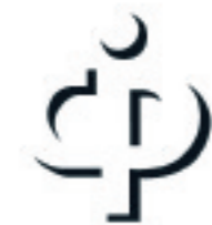
IMAGEN PÚBLICA® Colegio de Gran Clase®