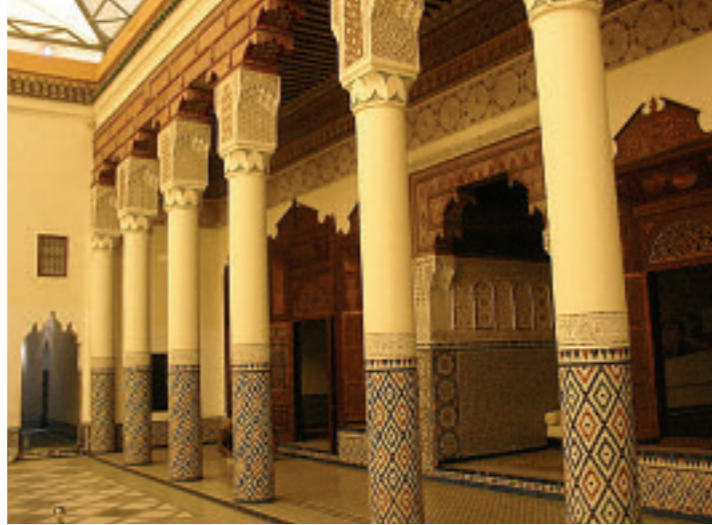
Patio interior del Museo de Arte Islámico, este lugar debe su fama a su maravilloso jardín con plantas de yuca y bambú.

En el patio del viejo mercado de especias, el Café des Epices en el 75 de Rahba Lakdima (tel. 00 212 2438 1770) le permitirá ordenar un jugo de naranja recién exprimido (15 pesos) y beberlo en la terraza donde podrá reclinarsse sobre los sofás color crema bajo el cobijo irregular de las sombrillas de mimbre, a ordenar sus pensamientos. •