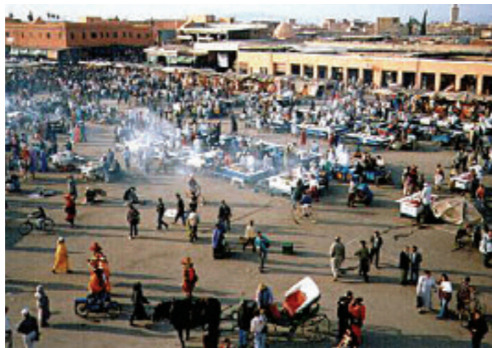
La plaza de Djemaa el Fnaa constituye un exponente vivo de lo que fueron las plazas en el Medioevo.

Al atardecer, el Djemaa el Fnaa se convierte en un festival medieval, repleto de encantadores de serpientes, narradores de historias, danzantes y curanderos. Resuenan los tambores, suenan las flautas, y el oeste de la plaza chisporrotea con los puestos de parrillas que sirven kebabs, salchichas y ensaladas de berenjena a los comensales sobre largas mesas. Espere pagar unos 70 pesos por un generoso plato de pollo a la parrilla, una ensalada o dos, y un agua mineral. •