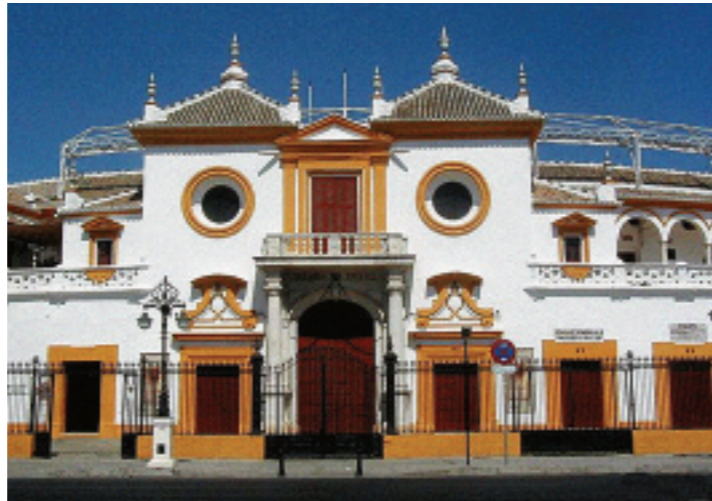
Visite el Museo de la Real Plaza de Toros que se encuentra bajo el graderío y conozca la tauromaquia de los siglos XVIII, XIX y XX.

Según su criterio, sólo nos resta informar que las corridas de toros forman parte de la vida cultural sevillana. La plaza de toros de la Maestranza en Paseo Colón (tel. 00 34 954 224 577; www.realmaestranza.com ) forma parte del recorrido. Los tours se llevan a cabo cada 20 minutos de las 9:30 a las 20 horas (19 hrs. en invierno); cuando una corrida de toros está programada, los tours se suspenden dos horas antes. Admisión, 75 pesos. •