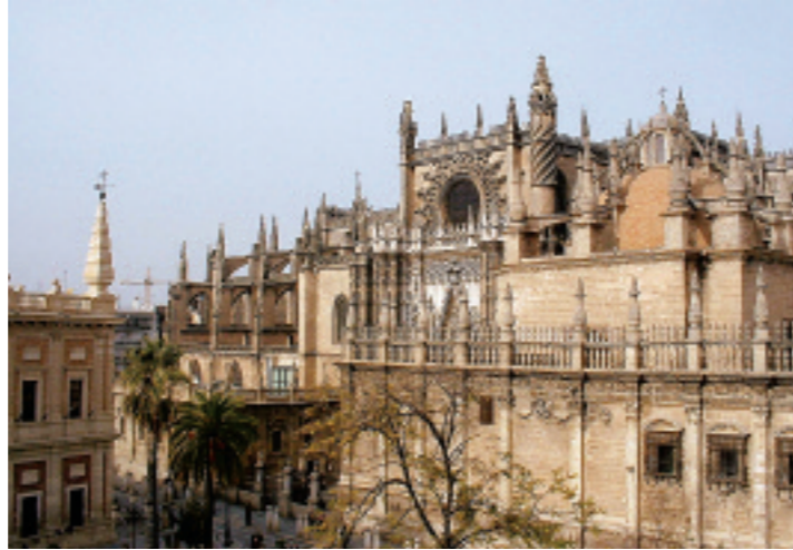
La Catedral de Sevilla asombrará a sus visitantes cuando caminen bajo sus bóvedas góticas que gozan de bellas iconografías.

Vaya por los encantadores jardines moros del Alcázar (tel. 00 34 954 502323; www.patronato-alcazarsevilla.es ), con sus frondosos naranjos, sus lechos de flores y sus refrescantes estanques. Mientras está dentro del complejo, admire los palacios, uno construido en un diseño moro, otro en estilo renacentista. Los palacios y jardines del Alcazar abren de 9:30 a 18:30 horas (domingos hasta las 17 hrs.) a diario desde abril hasta septiembre; entrada, 105 pesos. •