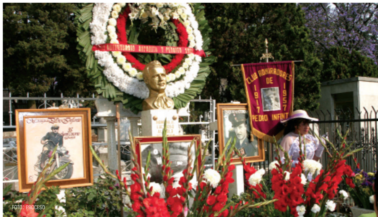
En su tumba, en un panteón del DF, nunca faltan flores.