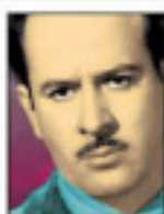
PORTADA PEDRO INFANTE