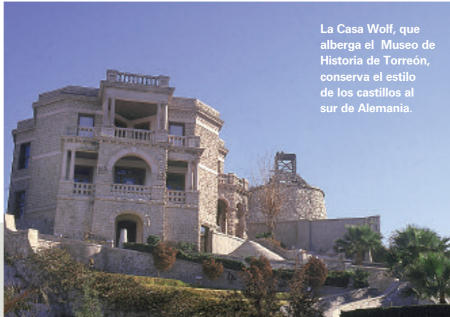
La Casa Wolf, que alberga el Museo de Historia de Torreón, conserva el estilo de los castillos al sur de Alemania.

El Museo Regional de la Laguna despliega una colección de piezas sobre la historia y condición de los pueblos prehispánicos que habitaron el norte de México en general, y la zona de la laguna de Mayrán en particular. Av. Juárez 1300 Oriente, dentro del Bosque Venustiano Carranza. Tel. (871) 718 3456. Abre de martes a domingo entre 10 y 18:30 horas. Si aún dispone de tiempo, conozca el Museo Paleontológico. Los fósiles marinos recuerdan que hace millones de años Coahuila estaba cubierta por el mar. Av. Juárez 580. Tel. (871) 713 9545. Abre de martes a domingo, de 10 a 18 horas. •