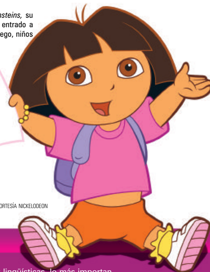
ILUSTRACIÓN: CORTESÍA NICKELODEON