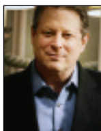
PORTADA AL GORE