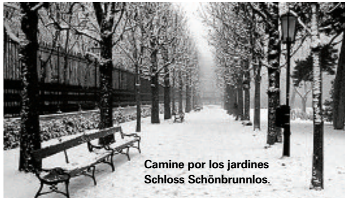
Camine por los jardines Schloss Schönbrunnlos.