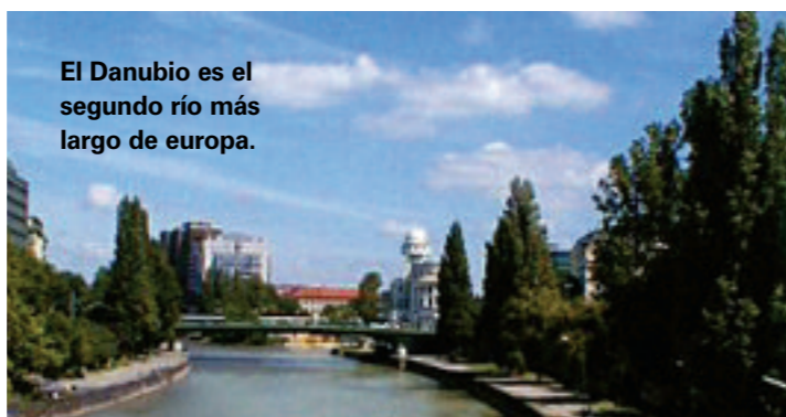
El Danubio es el segundo río más largo de Europa.

Vuele al aeropuerto Schwechat de Viena, por British Airways. Desde ahí estará a 17km al este del centro de la ciudad. La forma más rápida de llegar es abordando el CAT (Tren Ciudadano del Aeropuerto), que parte cada media hora hacia la estación Wien Mitte/Landstrasse y al que le toma tan sólo 16 minutos llegar. Cuesta €15 (euros) o 215 pesos viaje redondo. Un taxi hasta el centro de la ciudad le costará cerca de 650 pesos.